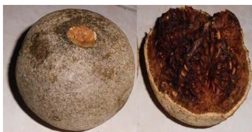
Gambar 2. Buah kawista

Penelitian ini menggunakan buah kawista matang (11). Daging buah kawista diambil dan disaring untuk memisahkan buah dari bijinya. Daging buah kawista ditimbang sesuai dosis (500/600/700mg/kg BB), dilarutkan dengan 1ml aquades/dosis, dicampur menggunakan pengaduk. Selanjutnya sediaan diberikan pada kelompok perlakuan melalui sonde lambung (14).